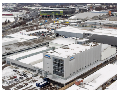
Standort St. Gallen